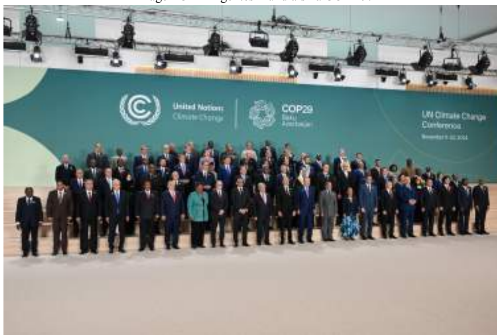
Imagem 3 - Dirigentes mundiais na COP-29.

Já na COP-29, uma coalizão informal de países, incluindo Arábia Saudita, Irã, Rússia, Egito e o Vaticano, se opôs a medidas sobre igualdade de gênero durante a COP-29, complicando as negociações para um novo programa de trabalho sobre o tema (Oliveira, 2024). Na foto oficial dos chefes de Estado e de governo presentes, apenas oito das 78 lideranças eram mulheres.