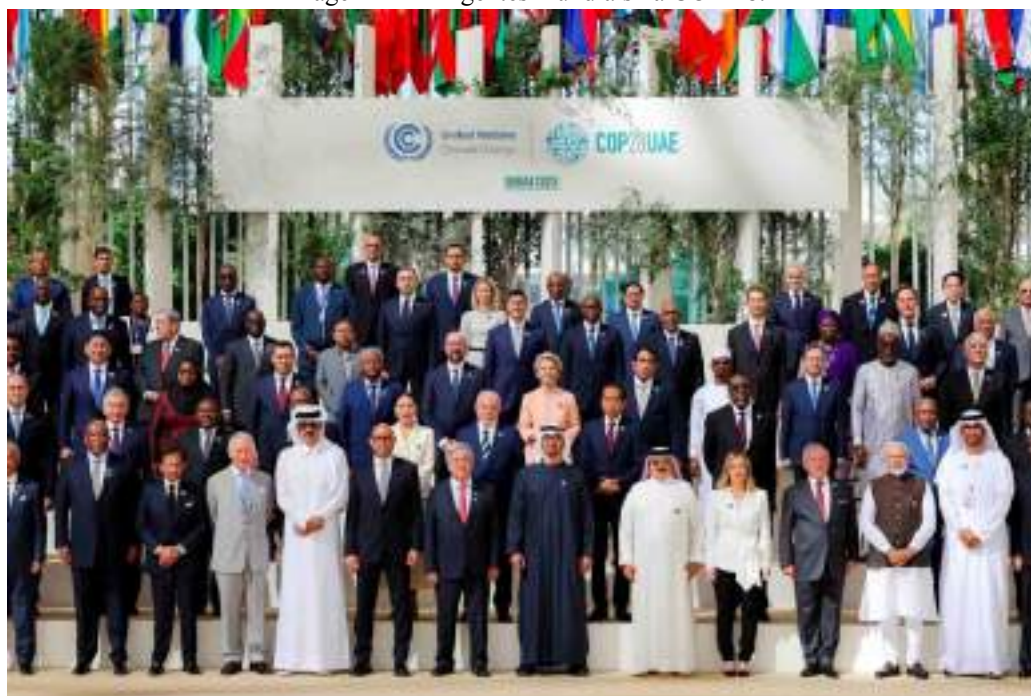
Imagem 2 – Dirigentes mundiais na COP-28.