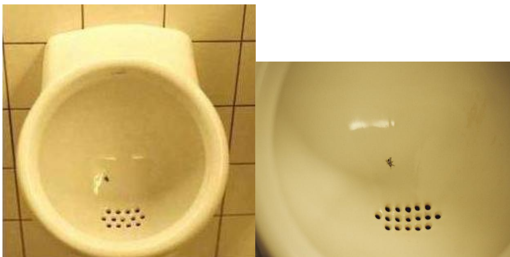
Figura 1: Mictório do Aeroporto de Schiphol

banheiro masculino. A simples medida formulada por um dos diretores do aeroporto, resultou em 80% de miras mais eficientes e, conseqüentemente, em banheiros menos sujos e malcheirosos. Apesar de não existirem estudos mais aprofundados, a redução dos gastos com limpeza no aeroporto são de 8%. O resultado da política comportamental, nesse sentido, resultou em banheiros mais agradáveis para os usuários e uma redução com os gastos de limpeza, de forma a favorecer o aeroporto.