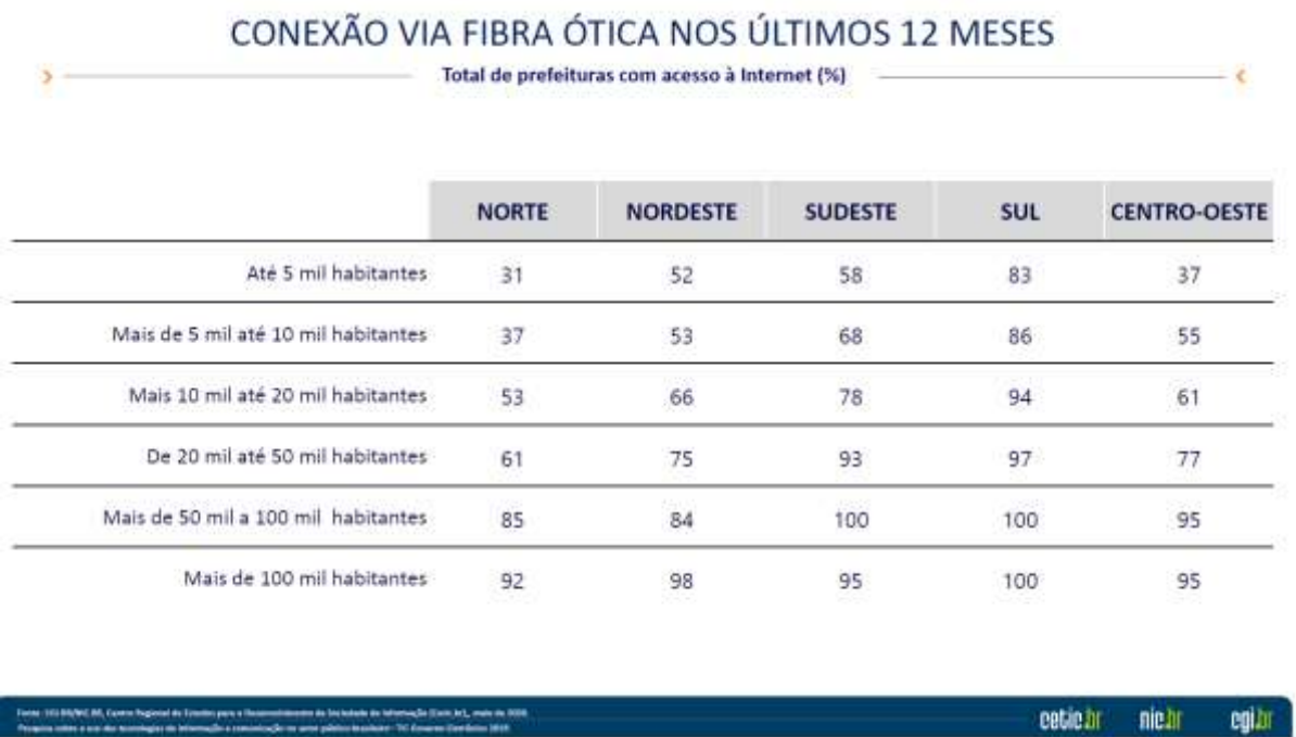
Figura 3 – Conexão via fibra ótica nos últimos 12 meses

De acordo com os dados, é possível avaliar que na pesquisa de 2017 o acesso à fibra ótica, principalmente nas regiões Norte, Nordeste e Centro-Oeste foi bem mais baixo, mas que em 2019 houve avanços.