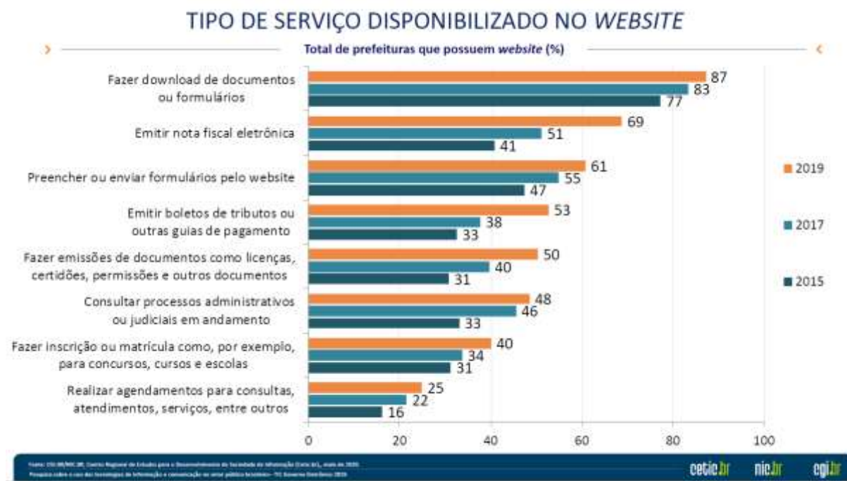
Figura 5 – Tipo de serviço disponibilizado no website

Voltando para análise do Cetic.br (2020), é interessante compartilhar alguns dados para que se tenha um entendimento da atuação da sociedade em relação aos serviços do governo eletrônico.