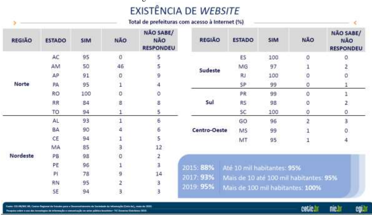
Figura 4 – Existência de website

Em relação as prefeituras com conexão de fibra ótica, o acesso à internet tem crescido consideravelmente, mas mesmo com um crescimento elevado, sabe-se que a comunicação é falha e que muitos habitantes nem sabem da existência do governo eletrônico. Um outro lado que não se observa na pesquisa é que não se sabe ao certo como o serviço de internet na região que tem fibra ótica é contratado e qual a quantidade de dados contratados. Sabe-se que a fibra ótica tem um desenvolvimento de transmissão muito maior que o uma conexão a cabo, pois ela permite transferir maior volume de dados.