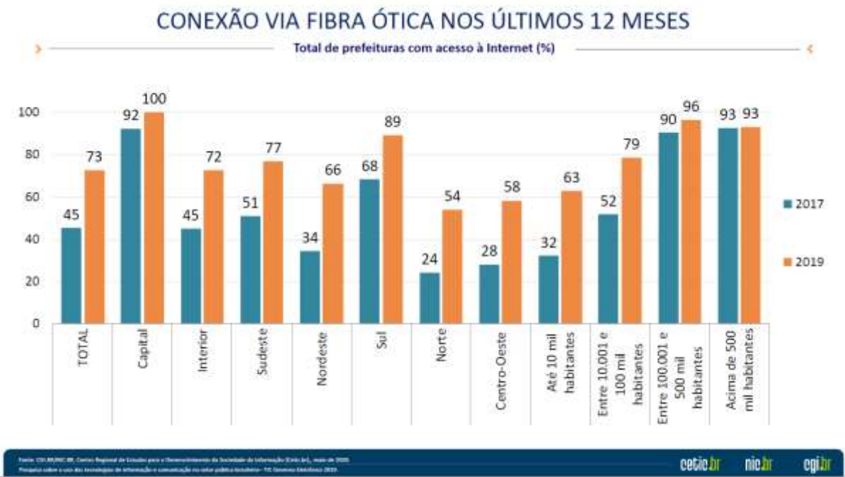
Figura 2 – Conexão via fibra ótica nos últimos 12 meses

de fibra ótica, a escala encontra-se em ascendência. No entanto, sendo uma análise geral, sabe-se que ainda não há disponibilidade de fibra ótica em algumas regiões.